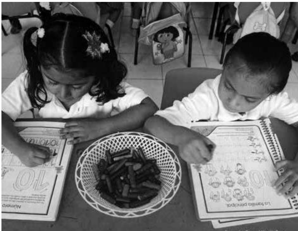
Evidencias de trabajo con el Grupo