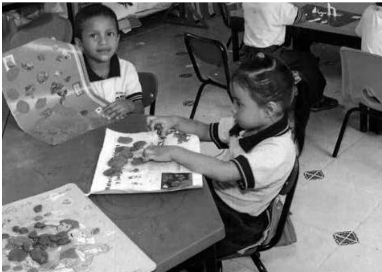
Evidencias de trabajo con el Grupo 1 * descripción de la actividad

A continuación, se presentan algunos ejemplos de fotografías: